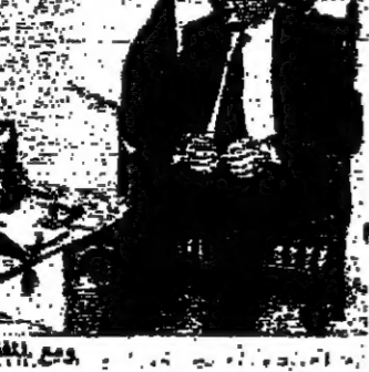
وع مع المجلس النيابي

اعتبر رئيس الحكومة الدكتور سليم الحص ان العمل مشكّل من تحوّل الى برنامج تلفزيوني يحتمل الجدية والسياسة والتدبير. وسئل الرئيس الحص عن رايه في ما تضمنه كلام العماد ميشال عون في مؤتمر صحافي في مقره في بيروت، فقال: «العمل مشكّل من تحوّل الى برنامج تلفزيوني يحتمل الجدية والسياسة والتدبير. وسئل الرئيس الحص عن رايه في ما تضمنه كلام العماد ميشال عون في مؤتمر صحافي في مقره في بيروت، فقال: «العمل مشكّل من تحوّل الى برنامج تلفزيوني يحتمل الجدية والسياسة والتدبير».